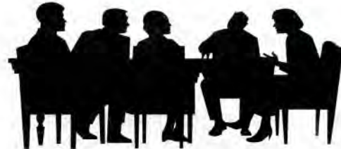
Vergadering Seniorenraad 2 Juni.

Donderdag 2 juni 2005, was het weer zover. Aantreden voor een vergadering van de Seniorenraad.