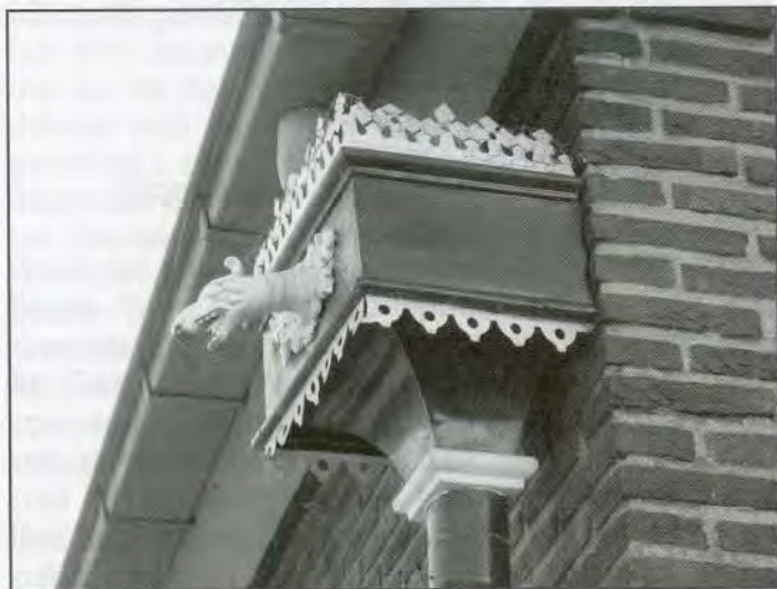
FOTO NR. 1 * WAT EN WAAR? DE OPLOSSING VINDT U OP BLZ. 10 VAN DEZE SCHAKEL.