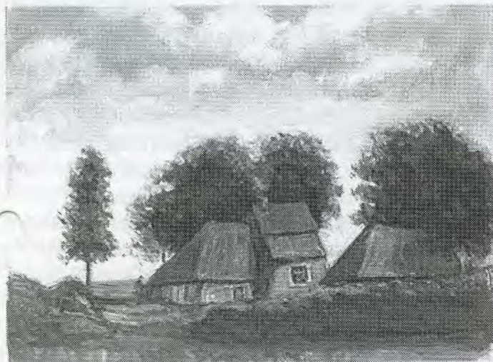
"De Crayenhut" - Frans van Baar - ± 1870

De Meulekief en de Veltumse Kleffen waren echte hoogten vanwaar je een breed panorama had over het dorp. In één blik kon je zien: Sint Jozef, Jerusalem, Grote kerk, de hoge kastanjes op de Grote Markt, het postkantoor en de paterskerk. Schilders maakten graag gebruik van deze hoogten.