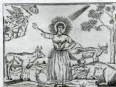
St. Brigida, patrones van het vee

Op vrijdag 7 september 2007 zal het bestuur van de KBO-Castenray recipiëren van 19.00-20.30 uur in gemeenschapshuis De Wis. Dit is gelegen bij de