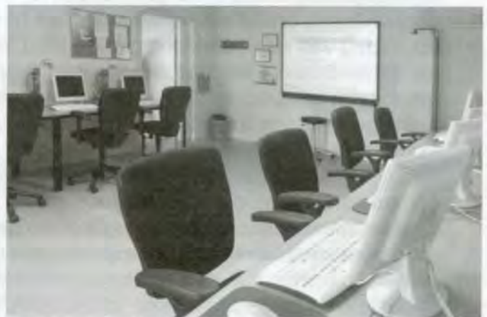
Het lokaal in "De Kemphaan". Hier kunt u ook zitten!