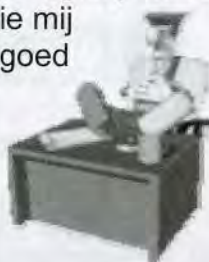
De secretaris is uitgewerkt

Ik spreek de wens uit dat het u allen goed mag gaan.