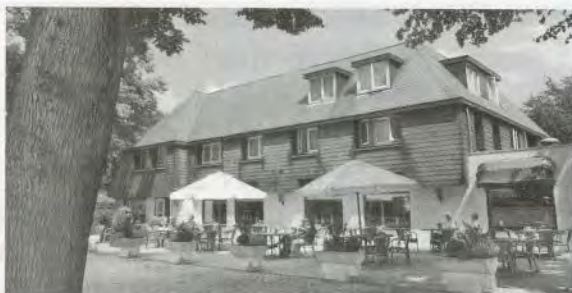
Hotel De Oringer Marke

Deelname is alleen mogelijk voor KBO-leden (eventueel met introduc e) uit Venray en kerkdorpen.