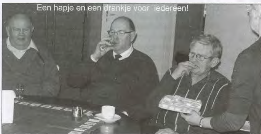
Een hapje en een drankje voor iedereen!

door de veelheid aan organisaties die zich inzetten voor de senioren. "Maar wat werken ze versnipperd", verzuchtte mevrouw Eekhout. Omdat iedere commissie of organisatie een deelonderwerp voor haar rekening neemt en geen zicht heeft op wat anderen doen, overlappen werkzaamheden elkaar en worden dingen dubbelop gedaan. "Waarom werken ze niet met elkaar samen, waarom is er geen integrale aanpak", vroeg de voorzitter zich af. "Elke organisatie zet zeker goede projecten op en realiseert ook wel goede resultaten, maar de samenhang en het overzicht van alles wat er aan