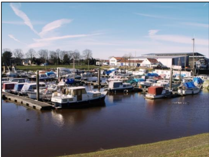
De jachthaven van Wanssum