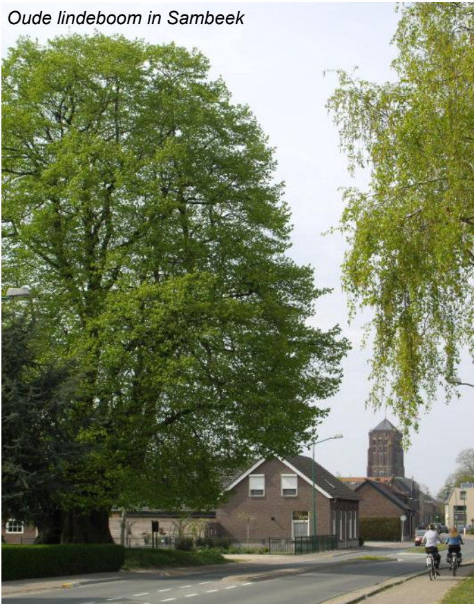
Oude lindeboom in Sambeek

De kruispunten nogmaals op een rij: Begin Venray kom: 17, 16, 61, 46, 40, 38, 37, 39, 44, 45, 15, 17. De totale route is 45 km. Het gehele traject is verhard, alleen rond knooppunt 39 is het fietspad wat aan de smalle kant zodat dit stuk bv. met een scootmobiel moeilijk te passeren is.