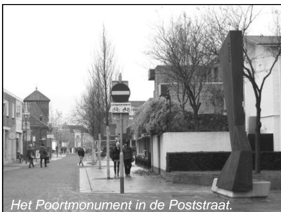
Het Poortmonument in de Poststraat.

Jammer dat de makers van deze 'poll' (engels voor kiezen) gekozen hebben voor witte letters op een zwarte ondergrond. Vooral in het beeldscherm is dat door ouderen en minder goed zienden slecht te lezen. Ze kunnen de tekst wat vergroten door rechtsonder in het beeldscherm het schuifje van '100%' naar bijvoorbeeld '150%' te zetten.