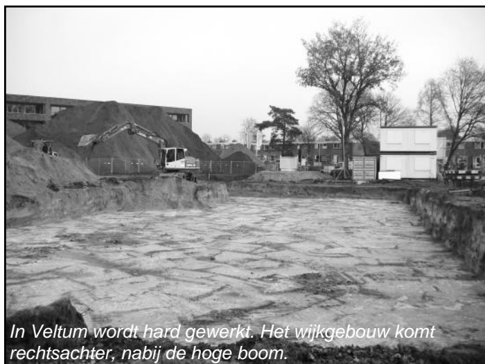
In Veltum wordt hard gewerkt. Het wijkgebouw komt rechtsachter, nabij de hoge boom.

Maar er zijn nog andere zorgpunten van zorg. De gemeente gaat er blijkbaar van uit dat haar eerste "aanspreekpartners" – wijkraden en organisaties-contact hebben met de wijkbewoners. Uit ervaring weten we, dat die contacten in de wijken minder intensief zijn dan in de kerkdorpen. Voor Veltum geldt dat de organisaties die binnen Veltum werken, weinig gebruik maken van de ervaring en deskundigheid van