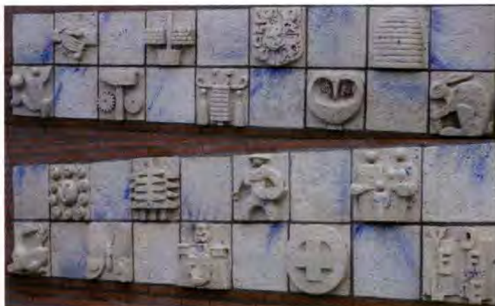
Venray in miniatuur

Zodoende is vanaf 1982 op de gevel van openbare basisschool De Landweert Venray in miniatuur te zien. Een werk van Piet Schoenmakers (1919 Roermond – 2009 Herten), toen lid van het Kunstatelier St. Joris Beesel. In samenspraak met het eerste schoolteam ontwierp de kunstenaar drie tableaux glazuurtegels met 21 afbeeldingen over heden en verleden van Venray, over de wijk en de school. De twee grootste tableaux sieren de buitengevel bij de hoofdingang. In één tableau zijn afbeeldingen opgenomen van een dierfiguur met haasje (de Schaapscompagnie), de beginletters van Venray en de (toen nog) tien kerkdorpen, een vlinder, bomen, de schutterij, de vlaszaaiër, de (psychiatrische) zorg, het gezin en Veldeke. Het andere tableau toont het spelend kind, samenwerken (vele handen maken...), industrie, bouw, muziekkorps, wapen van Limburg, de uil als symbool van wijsheid, een bijenkorf (uit het wapen van Venray) en de Piëlhaas. Het derde, kleinere tableau bevindt zich in het entreehalletje aan de kant van Hemelsleutel. Behalve hemelsleutels (zoals in het gemeentewapen) zijn opgenomen een boterbloem en een dam/schaakbord: denkend spelen is leren.