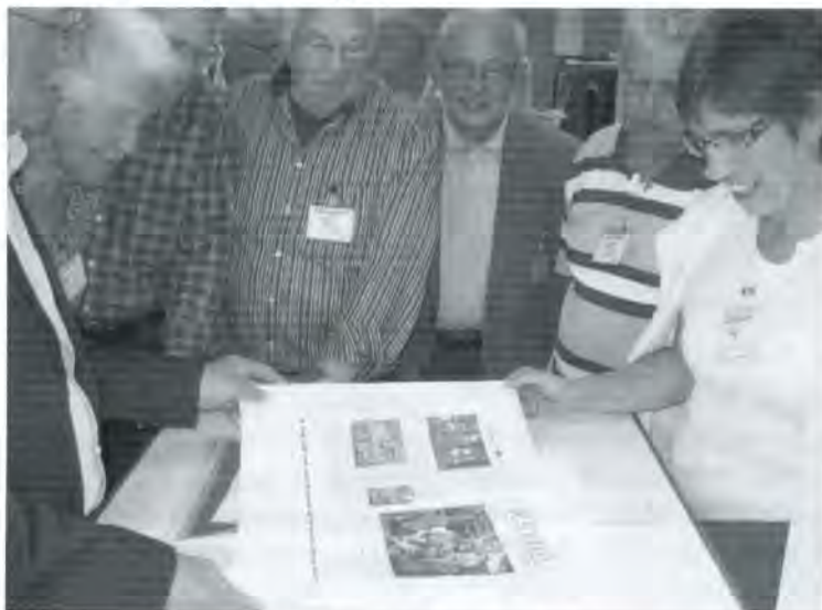
De redactie bekijkt glunderend de proefdruk van de nieuwe Schakel.

Al die artikelen worden vervolgens, drie we-