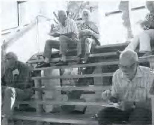
Hoe druk het was blijkt wel uit deze foto. Ouderen zochten met koffie en gebak een rustplek op de trap.

door Toon 'Valentijn' Jacobs versierde kerk was tot de laatste plaatsen bezet. Het geld van de collecte is bestemd voor de restauratie van het Sint Jozefbeeld in de buitenmuur van het voormalige Sint Josephklooster aan de Eindstraat.