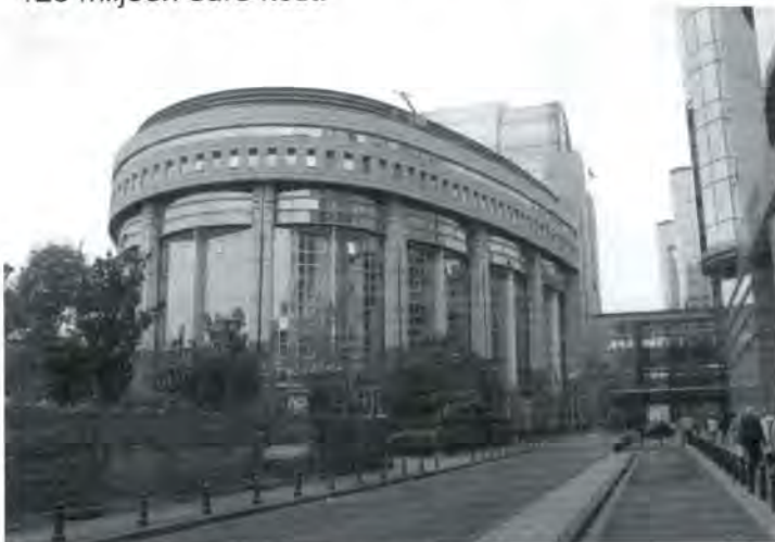
Hoofdgebouw EU in Brussel

Hij wijdde de ouderen een beetje in, in de dagelijkse gang van zaken in Brussel. Vooral het feit dat er drie weken in Brussel wordt gepraat en vervolgens alles en iedereen een week naar Straatsburg verhuist om te stemmen, deed de ouderen het hoofd schudden. Vooral ook omdat dit heen en weer getrek per jaar 125 miljoen euro kost!