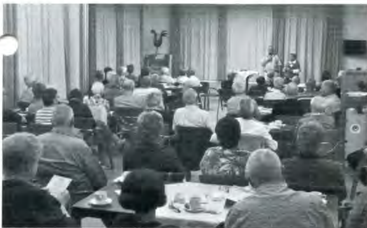
Elke bijeenkomst in De Kemphaan trekt tegenwoordig zo'n 80 bezoekers.

die periode is hun bekendheid gegroeid. Het Alzheimer Café startte in 2005 met gemiddeld veertig bezoekers, dit aantal is nu ruim tachtig!