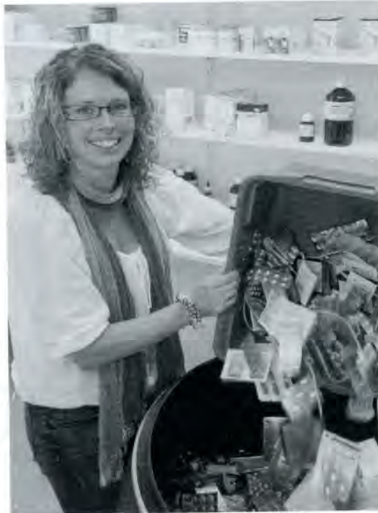
Anja Vissers

Iedereen in Nederland heeft een eigen bijdrage. Als je medicatie retour brengt, wordt dit gecrediteerd naar de eigen zorgverzekeraar van de patiënt. Dit roept weerstand op, want dat zou zo'n 'gedoe' zijn. Maar dit crediteren gebeurt nu ook al in de apotheek, bijvoorbeeld voor medicatie die niet is opgehaald door de patiënt. Dus dit is voor de apotheken een bekende handeling. De zorgverzekeraar krijgt het digitaal aangeleverd en stuurt de aangepaste rekening weer door naar de cliënt. Die ziet dit op het overzicht, dat iedereen krijgt met betrekking tot zijn eigen risico.