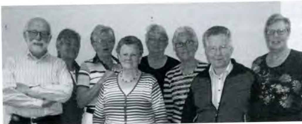
Het huidige bestuur KBO St. Leonardus Wanssum.