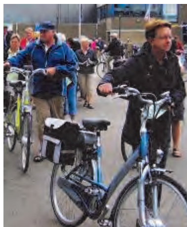
Ook tijdens de fietsvierdaagse zijn steeds meer elektrische fietsen te zien.

leert ook een nog recente studie van de stichting Wetenschappelijk Onderzoek Verkeersveiligheid (SWOV). Gemeenten en wegbeheerders moeten daar bij de plannenmakerij op letten. Zeker nu de vergrijzing toeneemt, is daar niets mis mee. Jaques Penris