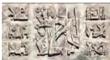
Reliëf Petrus' Banden

Veel aandacht heeft het niet getrokken, het reliëf boven de ingang van de toren en daarmee van de St. Petrus' Bandenkerk. Al een halve eeuw lopen de kerkgangers er doorgaans achteloos onder door. Veel publiciteit heeft het ook niet gekregen. Volgens RooyNet behalve een foto met gedeeltelijke uitleg in de serie Koester uw monument van Venray Monumentaal slechts een kort bericht in Peel en Maas, begin juni 1962. Samengevat: 'dit reliëf van beeldhouwer Jacques van Rhijn, in keramiek uitgevoerd boven de hoofdingang, geeft enkele beelden weer uit het leven van St. Petrus en is in zeer moderne stijl (!) uitgevoerd.' Verder