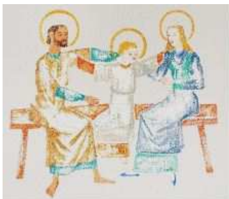
Heilige familie boven de kapstokken van de gezinsverpleging

Met de Floriade is ook Mindmap verleden tijd. Ook deze rubriek wordt bij deze afgesloten. Hopelijk hebt u van beide het nodige meegekregen en opgestoken. Die wens is niet de enige 'link' tussen beide. Tijdens de kunstmanifestatie kwam ondergetekende met St. Anna-kenner bij uitstek Twan van Els aan de praat over