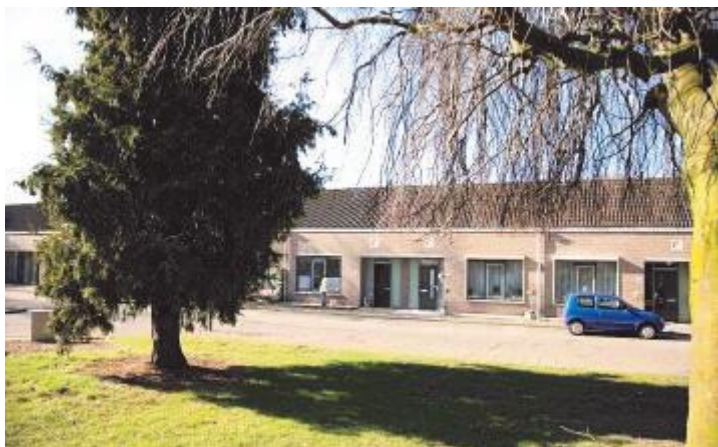
Seniorenwoningen aan de Kiosk in Brukske zijn gewild bij de ouderen

Tenslotte zijn er nog complexen als het Ambachts- en Joriskwartier, het Schuttersveld, het nieuwe De Mulder in Veltum en de Zuiderpoort in de bomenbuurt, waar mensen wonen die zorg nodig hebben. Hier gaat de toewijzing ook in overleg met De Zorggroep.