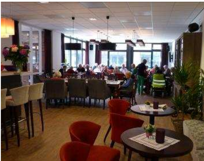
Het restaurant in wijkcentrum De Mulder

“In de ontmoetingsruimte De Tol in het Venrayse Ambachtskwartier zijn nu nog alleen activiteiten van het dagverzorgingsproject. Andere dingen, zoals de ontmoetingsmiddagen, zijn er niet meer. De exploitatie was niet rond te krijgen en we kunnen het ons niet veroorloven om daar nog langer geld in te steken”, zegt hij.