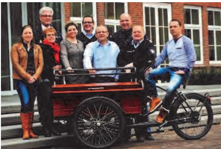
Het wijkteam Venray-Centrum en Centrum-West

Deze maand start het tweede wijkteam in de gemeente Venray. Het team gaat aan het werk in Venray-Centrum en Centrum-West. De belangrijkste taak van het wijkteam is om samen met bewoners en ondernemers problemen aan te pakken die deze bewoners en ondernemers belangrijk vinden. De werkwijze is dezelfde als in Landweert. Thema's waarmee de partners in het wijkteam snel aan de slag kunnen, pakken ze bij voorkeur samen met bewoners of ondernemers op of ze helpen hen met adviezen. Het wijkteam bestaat uit mensen van de gemeente Venray, woningstichting, politie en welzijnsstichting. Ook neemt een wijkverpleegkundige deel aan het wijkteamoverleg.