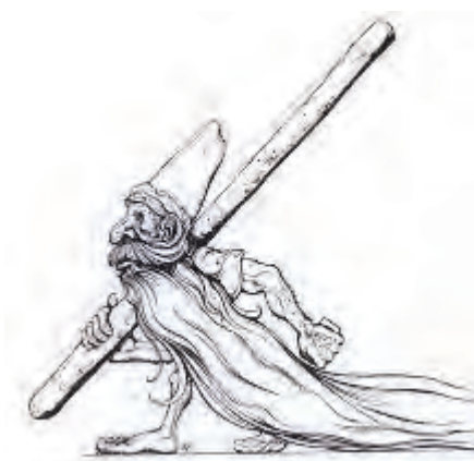
Illustratie: Anton Pieck bij de verhalen van 1001 Nacht.

Sinds begin van dit jaar staat op de achterpagina van De Schakel een nieuwe rubriek: Mijn favoriete kinderboek. In deze rubriek kijken we terug op boeken, strips of verhalen die we als beginnende lezer hebben verslonden. Niet alleen vragen we ons af, waarom u die zo mooi vond, wat u pakte. Maar we zoeken ook nuchter naar de oorsprong: wie schreef het boek, wie tekende het, waar komt het vandaan.