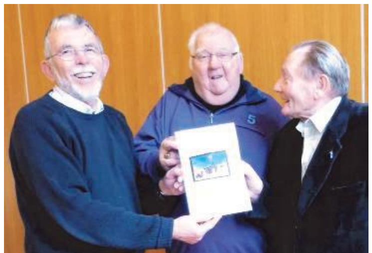
Het collectegeld eindelijk in goede handen

Diezelfde week nog meldde zich een slotenbedrijf uit Heijen. Een medewerker (of heet dit een kluzenaar?) kon de kluis kraken en dus de klus klaren. Kelken en andere gebruiksvoorwerpen voor de H. Mis kwamen weer tevoorschijn, alsmede het geld en de sigaretten van de koster. Daarna ging de koster op vakantie en kon de werkgroep Dag van de Ouderen nog enkele weken wachten op de centen. Maar uiteindelijk kan de werkgroep melden, dat de collecte voor de levende kerststal € 285,- heeft opgebracht.