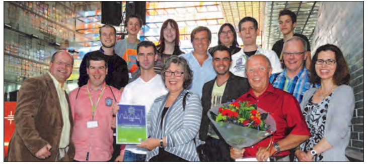
De groep van Omroep Venray, die de OLON-award in ontvangst nam.

In totaal heeft de Omroep honderd vrijwilligers. Dit lijkt en is veel, maar Omroep Venray verzorgt 24 uur per dag en zeven dagen in de week radio en sinds 2013 ook televisie. Om dit draaiende te houden heb je heel veel mensen nodig. Op de radio en televisie hoor en zie je alleen maar de presentatie of de programmamaker. Maar er zijn redactieleden nodig voor de voorbereiding, technici en cameramensen