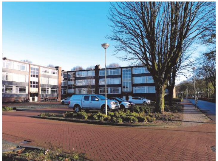
De flatjes aan de Zuidingel gaan midden dit jaar tegen de vlakte.

De woningen aan de Zuidsingel komen niet, zoals de PvdA Venray bepleitte, voor de opvang van statushouders in aanmerking. Die worden zoals het er nu uitziet, halverwege 2016 gesloopt.