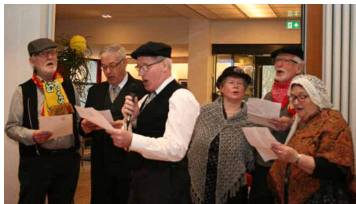
Het bestuur begroet de leden zingend.