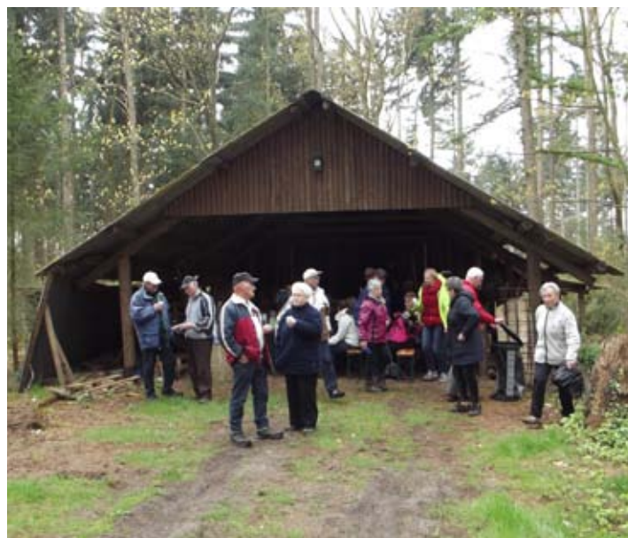
Even zitten voor koffie met koek.

Wilt u meer lezen over wat er voor ouderen te doen is?