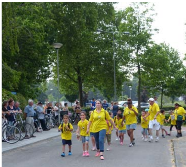
De jeugd wandelt, de ouderen staan aan de kant.