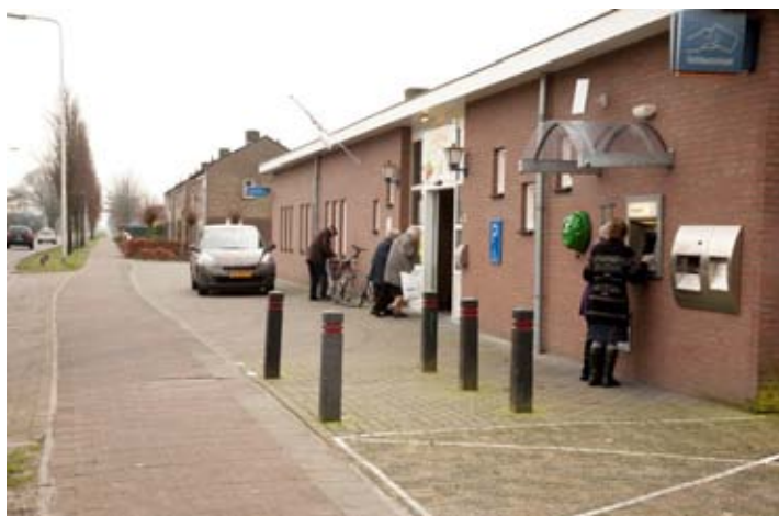
Het dorpshuis in Ysselsteyn wordt over enkele jaren verplaatst naar de school.

De gemeente heeft inschattingen gemaakt hoeveel geld er voor al die plannen nodig zal zijn en is uitgekomen op ongeveer € 3,5 miljoen. Zeven ton komt al beschikbaar door de niet meer te betalen subsidiegelden.