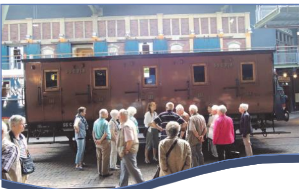
Bij de oudste wagon in het Spoorwegmuseum

KBO VENRAY IN UTRECHT: Op 16 juni vertrok een volle bus met senioren voor een dagtrip naar Utrecht.