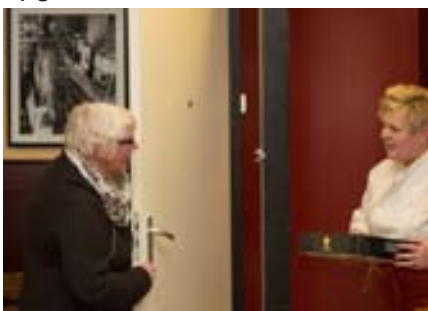
Er komt zomaar iemand met een cadeau aan de deur. Trapt u daar in?

Regelmatig waarschuwt de politie voor babbeltrucs. Iemand kletst zich naar binnen in uw huis en voordat u het weet bent u uw portemonnee of sieraden kwijt. Maar hoe vaak komt dit nu echt voor? Uit onderzoek blijkt dat 22 procent van de ondervraagden ooit is opgelicht door een babbeltruc. Maar bij de meeste