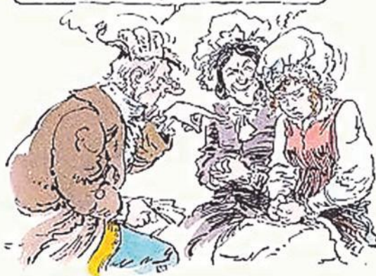
Tekening Jan Kruis

Kunt gy eieren leggen, juffrouw Laps? Dit vraag ik maar, slechts dit: kunt gy eieren leggen... hé? Dan zyt gy een zoogdier, juffrouw Laps.