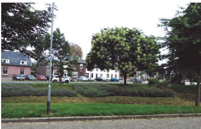
De Paoterskoel, bijna honderd jaar geleden (boven) en nu.

Vroeger hadden veel dorpen 'koele' (kuilen) met water. Die waren in de tijd dat een huis nog geen kraan had en wasmachines nog niet bestonden, bedoeld voor het doen van de was. Ook waren ze nuttig bij het blussen van branden. Met de aanleg van waterleidingen waren die koele niet meer nodig. De laatste jaren echter zijn ze weer teruggekomen in het straatbeeld, zoals in het Wijnhovenpark, waar vroeger de Paoterskoel lag. Niemand doet er de was en de brandweer heeft zijn brandkranen. De koele zijn nu nodig om water op te vangen bij hevige regenval. Wie kent niet de overstromingen op de Paterslaan-Kruisstraat in de vorige eeuw.