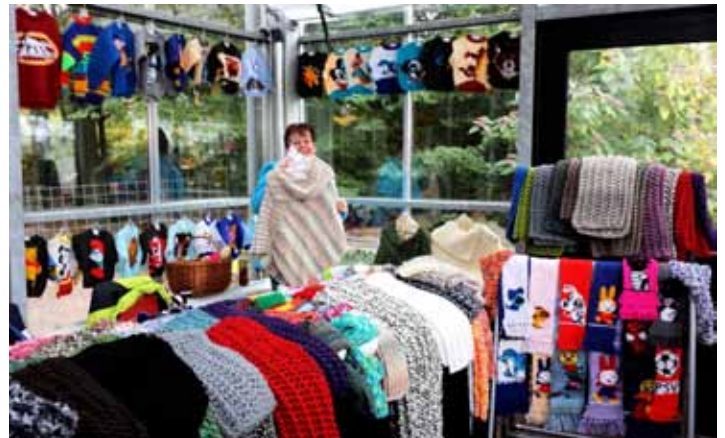
Tekst: Leo Broers

Gevraagd naar de levenswijsheid van Thea, verklaart zij: "Als de tijd rijp is, komt er altijd wel iets op je pad".