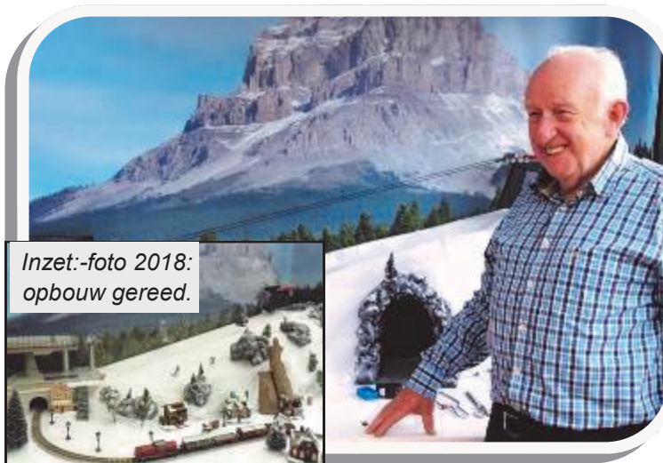
Inzet:-foto 2018: opbouw gereed.