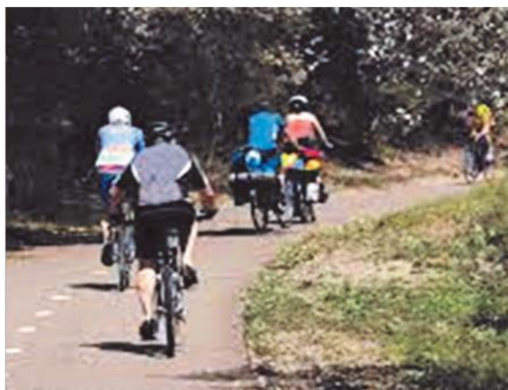
Verschillende snelheden en breedtes op het fietspad

Een ander idee is dat de overheid moet overgaan tot de aanleg van aparte fietspaden voor snelfietsers en bromfietsen, dan wel fietspaden zodanig moet verbreden dat passeren minder moeilijk en gevaarlijk is. Verbreding is ook nodig vanwege de groei van het aantal bakfietsen en mogelijk straks weer de stints. Het is in elk geval een probleem om goed over na te denken.