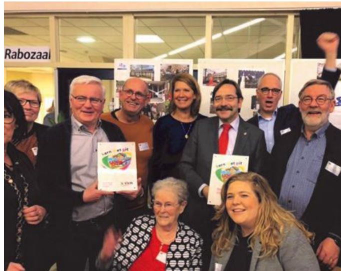
Castenray werd met De Stek al enkele malen onderscheiden. Op de foto de uitreiking van de provinciale prijs Kern met Pit.

De bouwprojecten in de kleinere dorpen passen in het provinciale plan Kwaliteit in Limburgse Centra (KLC). Provinciale Staten hebben hiervoor eind vorig jaar 25 miljoen euro beschikbaar gesteld. Het doel is het verbeteren van de woon- en leefomgeving in wijken en dorpen waarbij woningbouw in kleine kernen voorrang krijgt.