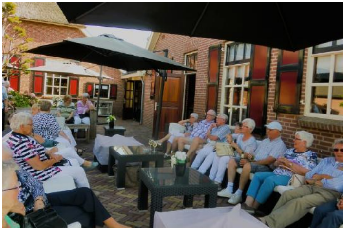
Uitstapje 2016: De IJsselhoeve, Doesburg

De Vereniging voor Ouderen Noord-West (VVO Noord-West) viert maandag 12 december 2022 haar 25-jarig bestaan. Het zilveren jubileum wordt gecombineerd met de traditionele jaarlijkse kerstviering in wijkcentrum Den Hoender. Alle leden van de ouderenvereniging worden daarvoor binnenkort uitgenodigd.