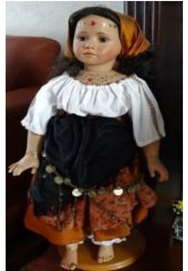
Canadese pop.

Inmiddels is Annie acht keer in Canada en Amerika geweest, telkens om de twee jaar. De eerste keer vloog ze met haar man zaliger vanaf Schiphol naar Heathrow (Londen) om vandaaruit een rechtstreekse vlucht te nemen naar Toronto (Canada). "Vanaf de luchthaven werden we als VIPS opgehaald en naar onze verblijfplaats gebracht ten zuiden van de stad.