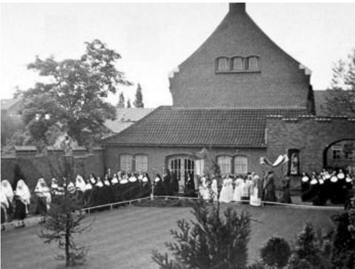
Foto: Mariaprocessie Jerusalem 1955.

Venray heeft veel kloosters gekend. Deze kloosters hebben zowel op maatschappelijk gebied (onderwijs, opvoeding, zorg) als in economisch opzicht een belangrijke rol gespeeld. Een van deze kloosters is bekend onder de naam Jerusalem. Het klooster stond op de plaats van het huidige gemeentehuis.