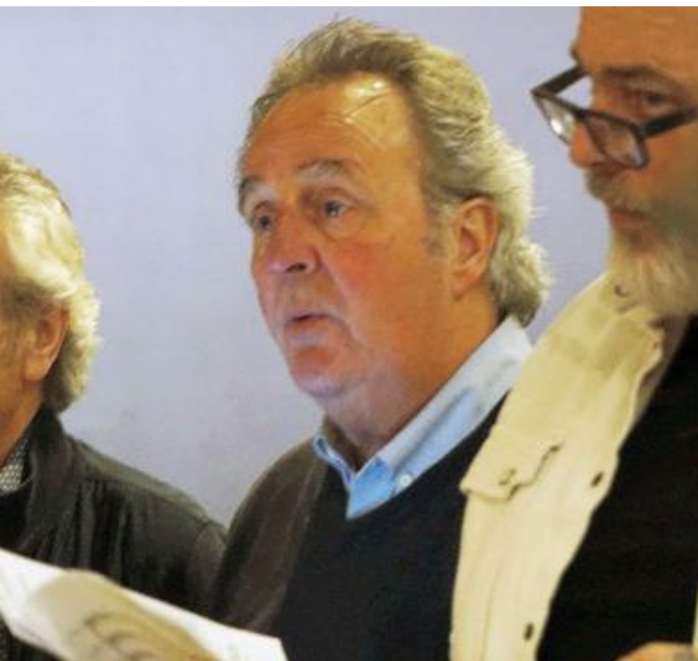
concentratie tijdens een repetitie van het Venrays Mannenkoor.