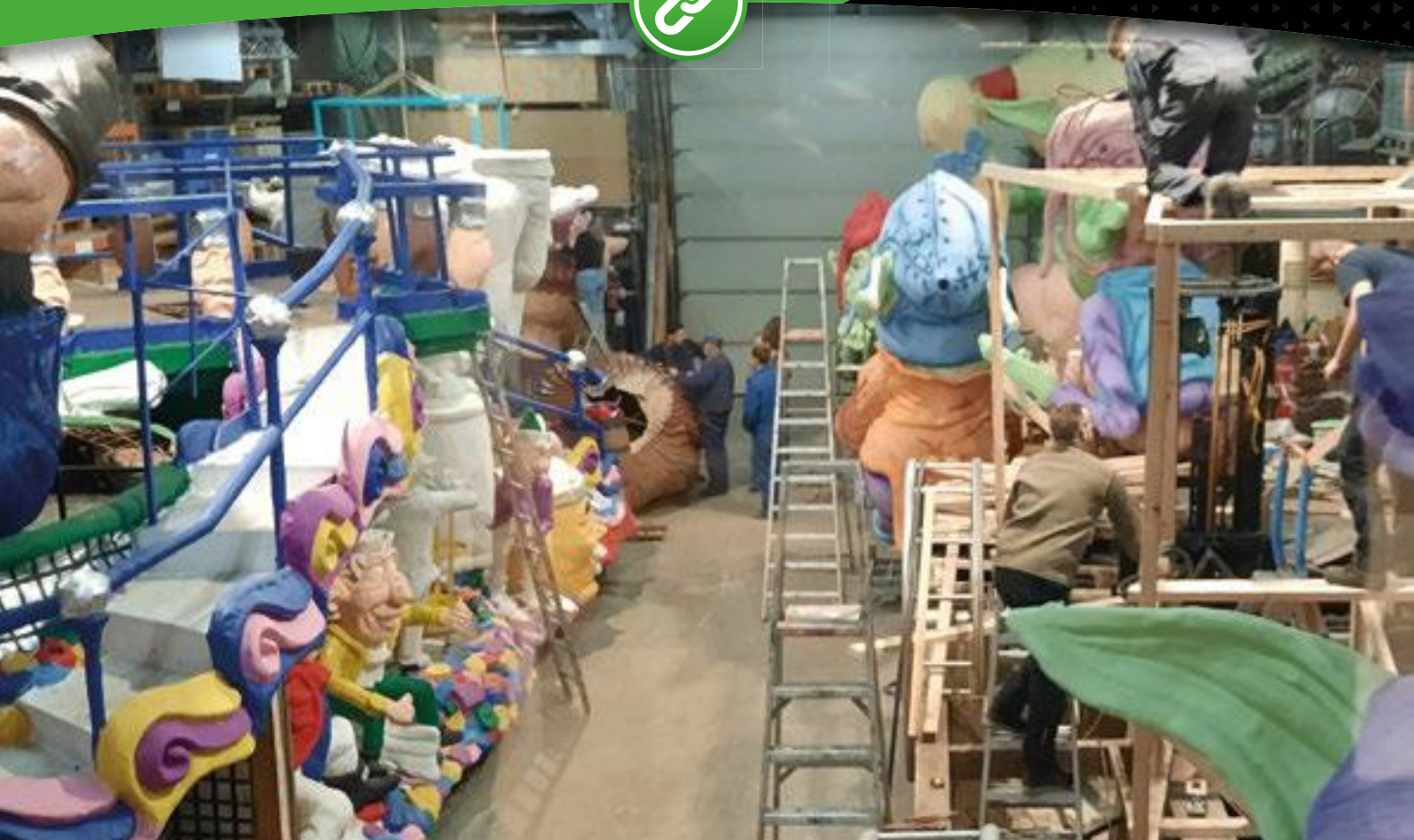
Wagenbouwers aan het werk in de loods van De Piëlhaas en D'n Hazekeutel.