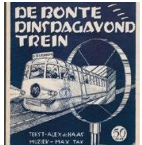
De Bonte Dinsdagavondtrein.