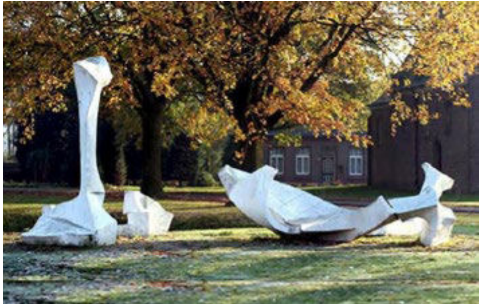
Het kunstwerk aan de Langstraat heet Ontwaken .

Maar het kunstwerk Ontwaken had een veel burgerlijker bestemming. De gemeente Venray had Gussen Wie gevraagd om in een kunstwerk