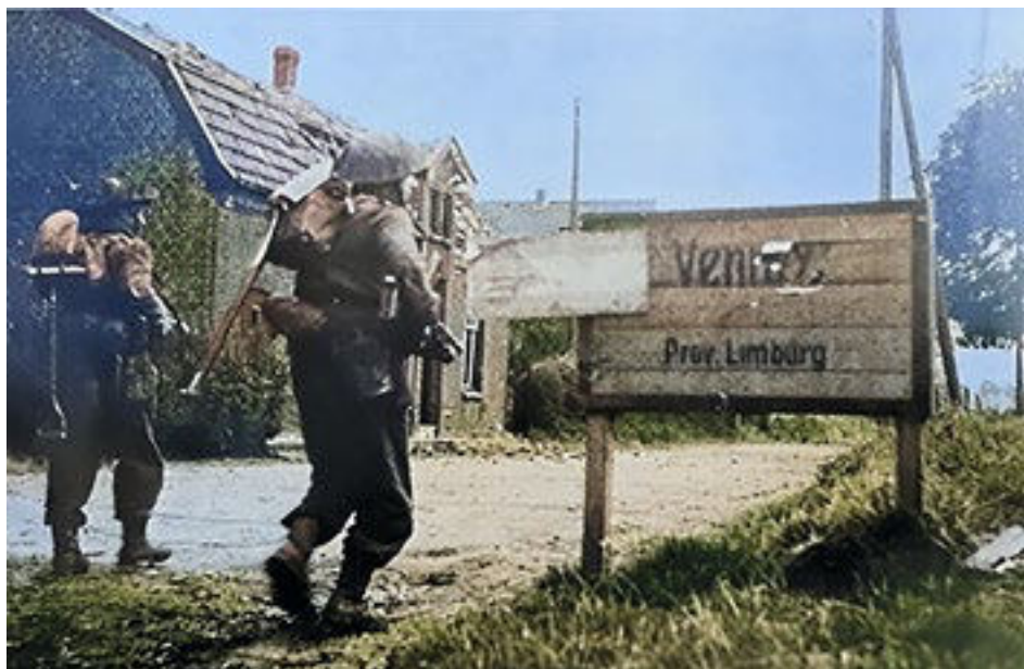
De bevrijding van Venray.

In oktober van dit jaar is het tachtig jaar geleden dat Venray werd bevrijd. Het was een periode waarin de verwoestingen in deze omgeving enorm waren. Veel inwoners van Venray werden geëvacueerd. De situatie was zeer ernstig, omdat veel huizen werden vernield, het openbaar leven onmogelijk was en je zelfs voor je leven moest vrezen door verdwaalde bommen en mortiergranaten. We zien de beelden van Oekraïne en Gaza en stellen vast dat vreselijke leed dat bij een oorlog hoort, nog steeds wordt geleden.