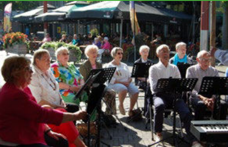
Optreden projectkoor Zing je Fit op Schouburgplein.

Bezoekers van het minifestival Venray Dementievriendelijk genoten onlangs op het Schouburgplein in Venray van het eerste optreden van Zing je Fit.