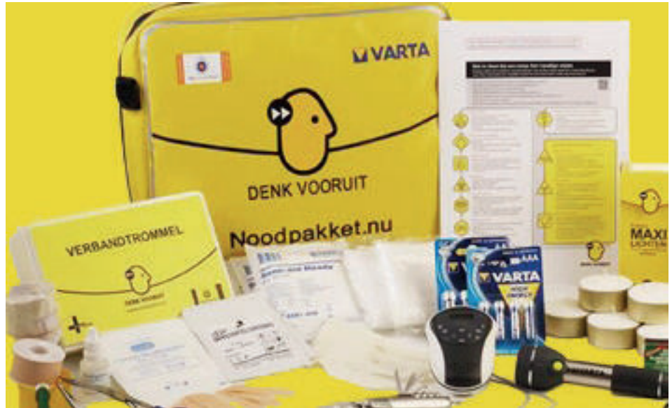
Een noodpakket samenstellen is makkelijk.

U kunt uw e-bike, scootmobiel of auto niet meer opladen. De zonnepanelen, de boiler, de elektrische deken,