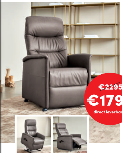
FLORENCE Leder: 71 Torro Vulkan 2 motorig | opstahulp