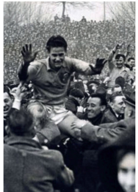
Feest na de winst van Oranje op Duitsland in 1956.

Als kinderen waren we nog niks gewend. Televisie. Alles was apart, zelfs de eigen goal van Cor van der Hart achter zijn eigen keeper Frans de Munck. Gaf niks, we stonden toen al met 2-0 voor door goals van 'us' Abe Lenstra. Kees Kuijs, Roel Wiersma waren