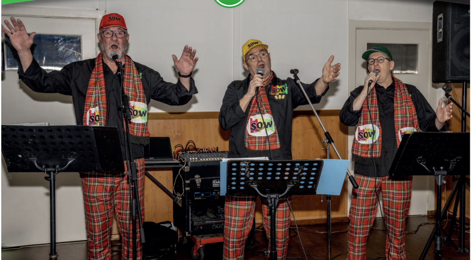
SOW!!! brengt de sfeer erin tijdens de de laatste nieuwjaarsreceptie in Op 't Nipperke.