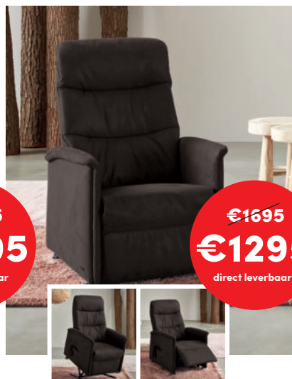
SIENNA Stof: 13 Nevada Mocca 1 motorig | opstahulp