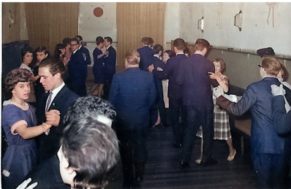
Dansles was niet leuk. Het was een plicht.

Grijs, donkerblauw, zwart, effen streepje, ruitje. Allemaal dezelfde prijs. Mijn vader spreekt de verkoper aan: "wat is zijn maat?", doelend op mijn 16-jarige postuur. De verkoper doet een inschatting en dan kunnen we naar dat deel van het lange rek waar mijn maat zo ongeveer zal hangen. Mijn vader haalt een pak uit de rij. "Hier. Mooi blauw. Is dat wat?" Ik heb geen idee en voordat ik echt aan denken toekom, sta ik al achter een gordijn en trek het pak aan. "Zit het goed?", vraagt mijn vader. Ik heb geen idee